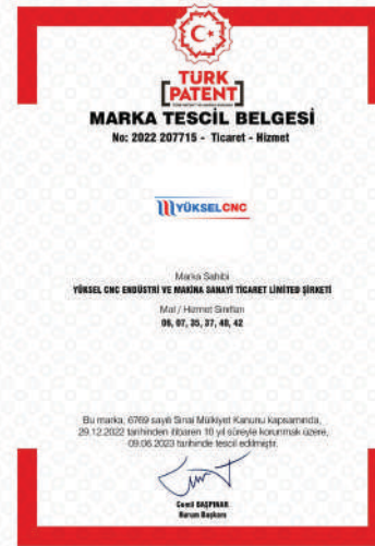
Marka Tescil Belgesi