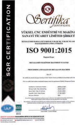
ISO 9001 : 2015