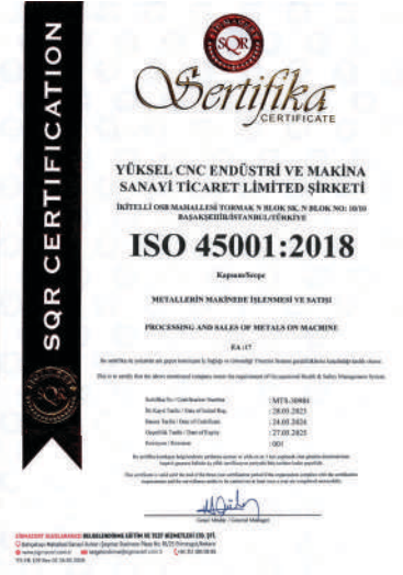
ISO 45001 : 2018