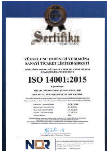
ISO 14001 : 2015